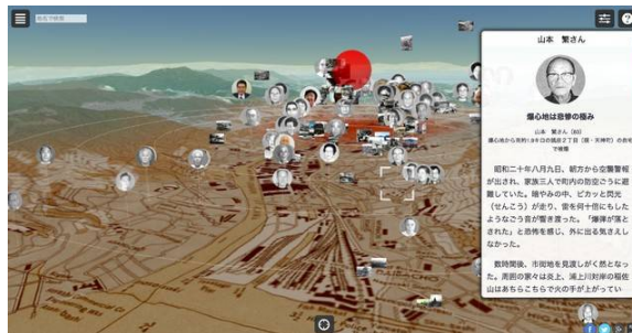
画像：左) 2015年のワークショップ開催風景 右) 「ヒロシマ・アーカイブ」画面